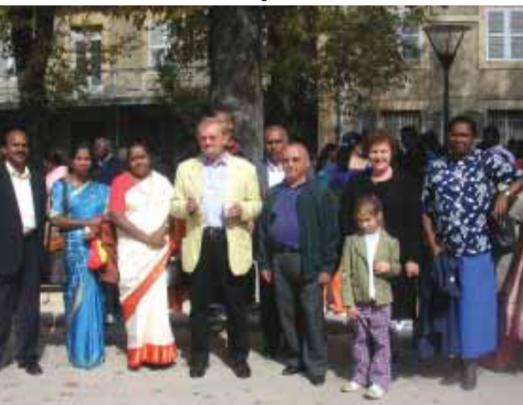
■ Convívio entre culturas, em Lyon

«A nossa fé comum em Maria, Mãe de Jesus, e os laços históricos fazem com que uma grande amizade se possa instalar entre as nossas Comunidades... Este é mais um passo dado nessa direc-