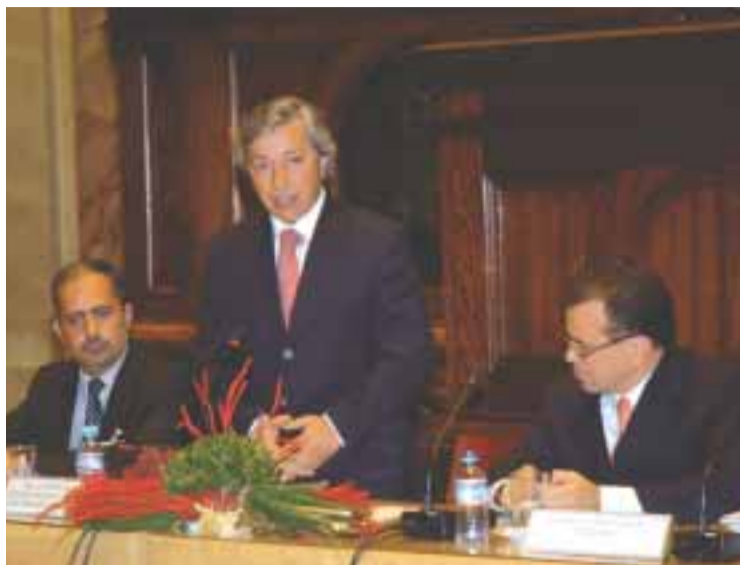
Conselheiros das Comunidades reúnem-se na Assembleia da República

Os Conselheiros anunciam ainda que vão terminar duas propostas que estiveram em consulta junto do CCP: uma delas é uma série de propostas para aumentar a participação cívica dos Portugueses,