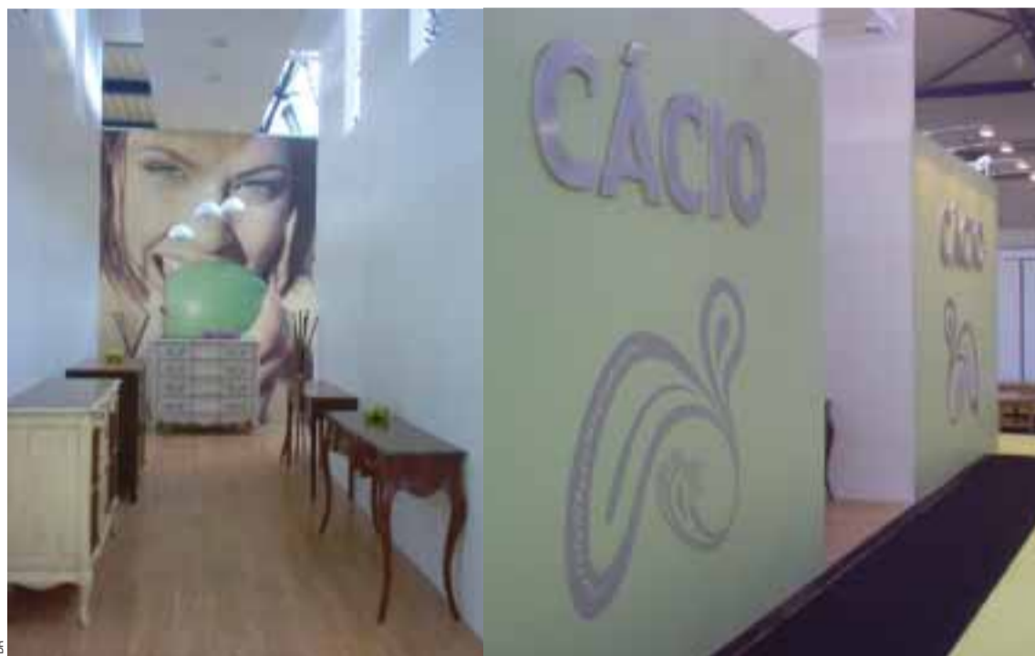
■ Aspecto do stand dos Móveis Cácio, no Salão de Reims

O fabricante de Móveis Cácio, de Rebordosa, ganhou recentemente o segundo prémio do melhor stand no 13º Salão Profissional do Móvel e da Decoração, de Reims.