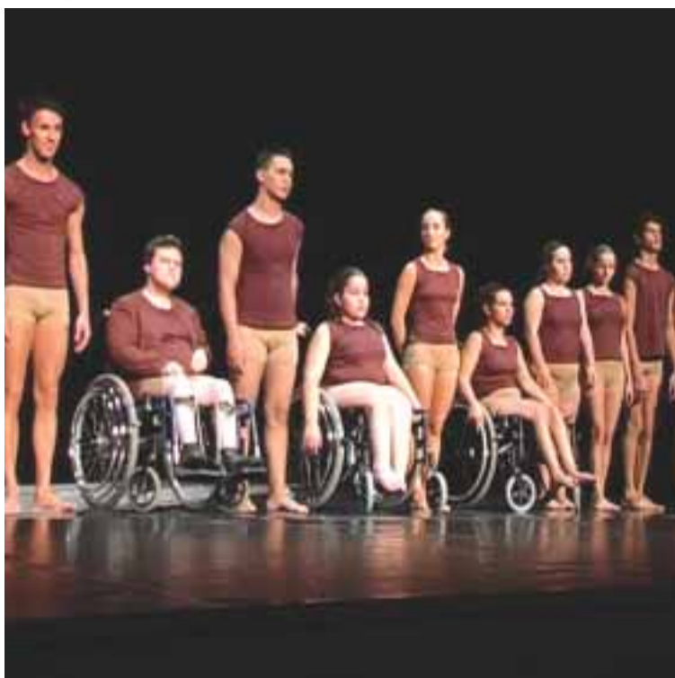
■ Grupo Dançando com a Diferença no palco do Théâtre Montansier, em Versailles

O grupo português era bastante esperado no festival francês. O cartaz tinha aliás uma fotografia do grupo. «Isso deu-nos uma maior responsabilidade. Sabemos